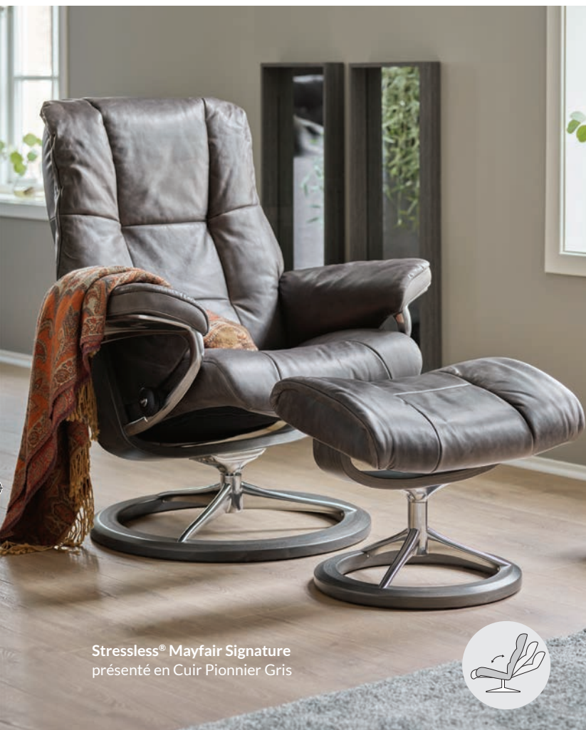
Stressless® Mayfair Signature présenté en Cuir Pionnier Gris