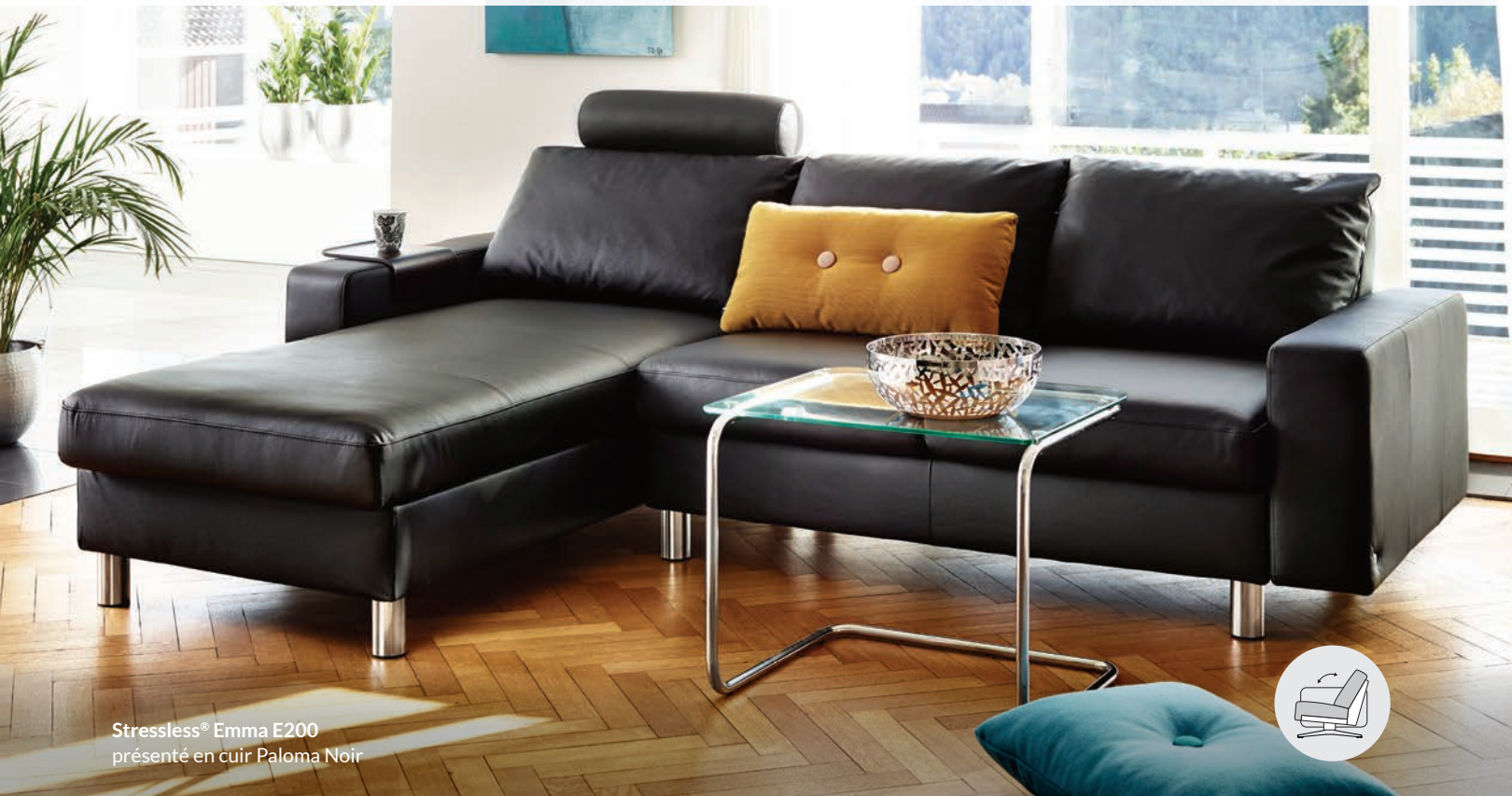
Stressless® Emma E200 présenté en cuir Paloma Noir

Voici l'occasion parfaite d'économiser sur les sièges Stressless®. Obtenez jusqu'à 1 500 $ de crédit sur des sièges Stressless® ou un rabais de 500 $ sur un fauteuil inclinable et pouf avec base Signature ou un fauteuil inclinable avec système LegComfort™. Aussi, obtenez un rabais de 50 $ sur chaque chaise de salle à manger à l'achat de 4 chaises ou plus.