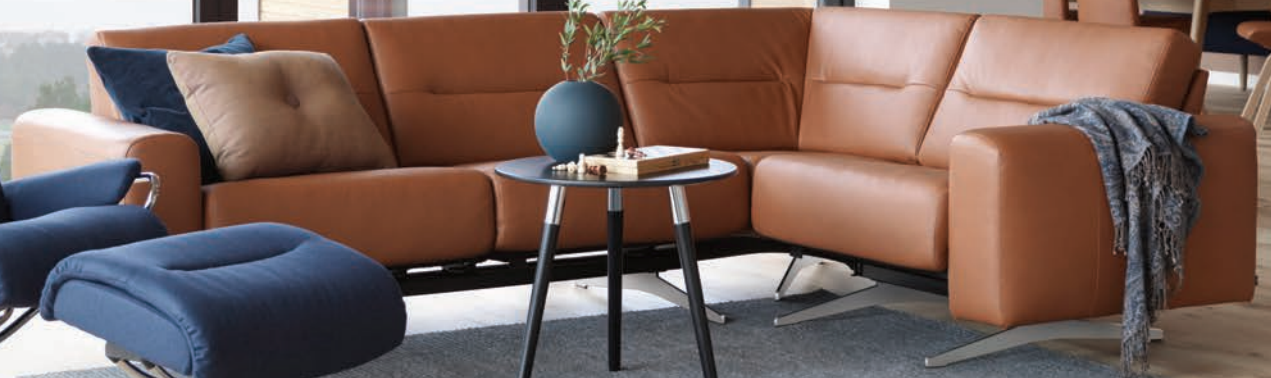
Stressless® Stella présenté en cuir Paloma Cuivre

VOIR TOUTES LES OFFRES À L'INTÉRIEUR! Jusqu'au 21 octobre.