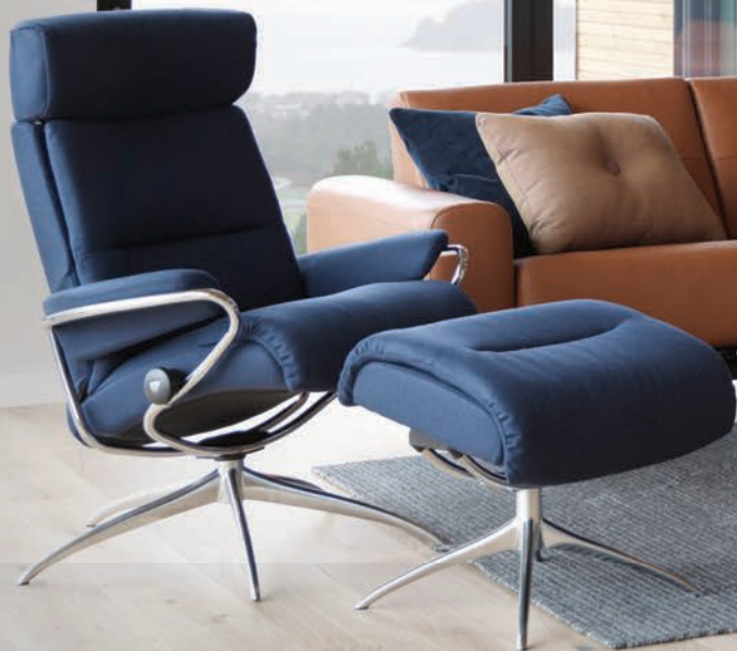
Stressless® Tokyo présenté en tissu Calido Bleu

Découvrez ce que les Norvégiens savent depuis 1971 : les fauteuils Stressless® sont les plus confortables au monde. Nos systèmes confort brevetés Plus™, Glide™, LegComfort™ et BalanceAdapt™ rendent nos luxueux fauteuils inclinables, canapés, fauteuils de bureau et chaises de salle à manger supérieurs à tous les autres. Prenez place dans un fauteuil Stressless® et sentez la différence.