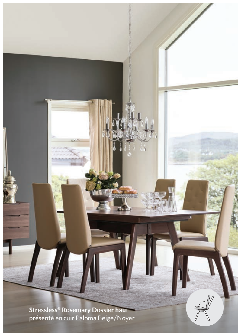
Stressless® Rosemary Dossier haut présenté en cuir Paloma Beige / Noyer

Les fauteuils inclinables Stressless® avec base Signature sont dotés du système BalanceAdapt™, qui offre un léger mouvement de balancement et les fauteuils Stressless® avec système LegComfort™ sont dotés d'un repose-pieds qui se déploie et se rétracte au simple effleurement d'un bouton.